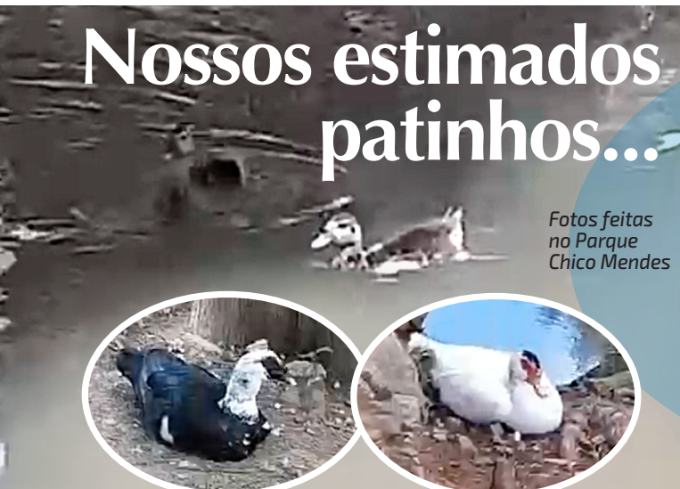
Fotos feitas no Parque Chico Mendes

... foram encaminhados ao Parque Chico Mendes, onde dispõem de um ambiente mais amplo e da companhia de outras aves.